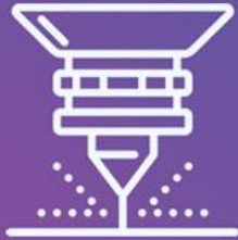
دستگاه برش لیزر