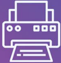
دستگاه چاپ بنر