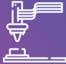
دستگاه سی ان سی