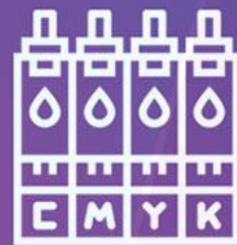
جوهر و ملزومات